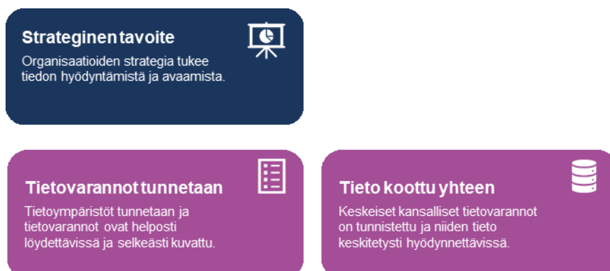
Kuva 4. Organisaation strategisen tavoitteen asettamisen edellytyksiä

Riittävät tietovarannot ovat organisaatioille elinehto. Tämä ei kuitenkaan vielä usein näy strategioissa. Tietovaranto hyvin usein liittyy kiinteästi toimijan perustehtävän hoitamiseen. Tapahtumat ja päätökset kirjataan tietovarantoihin (rekistereihin) sekä käsitellään automaattisesti. Tämän aseman tunnistamiseen liittyy hyvä tuntemus omista ja muilta käytössä olevista tietovarannoista.