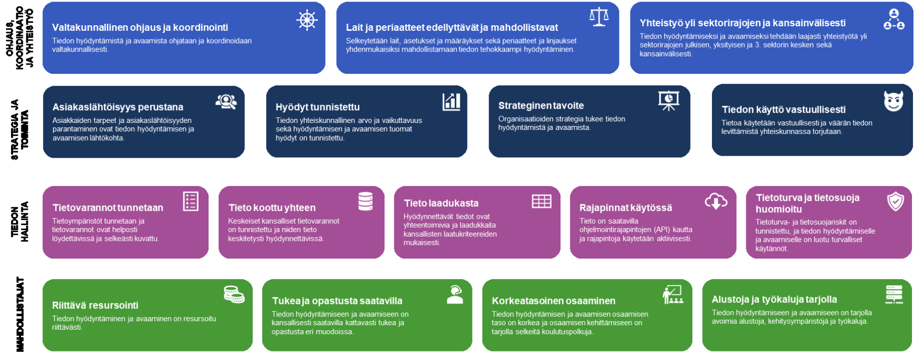
Kuva 1. Tietopolitiikan strategiset tavoitteet – kohti kattavaa tiedon hyödyntämistä ja avaamista.