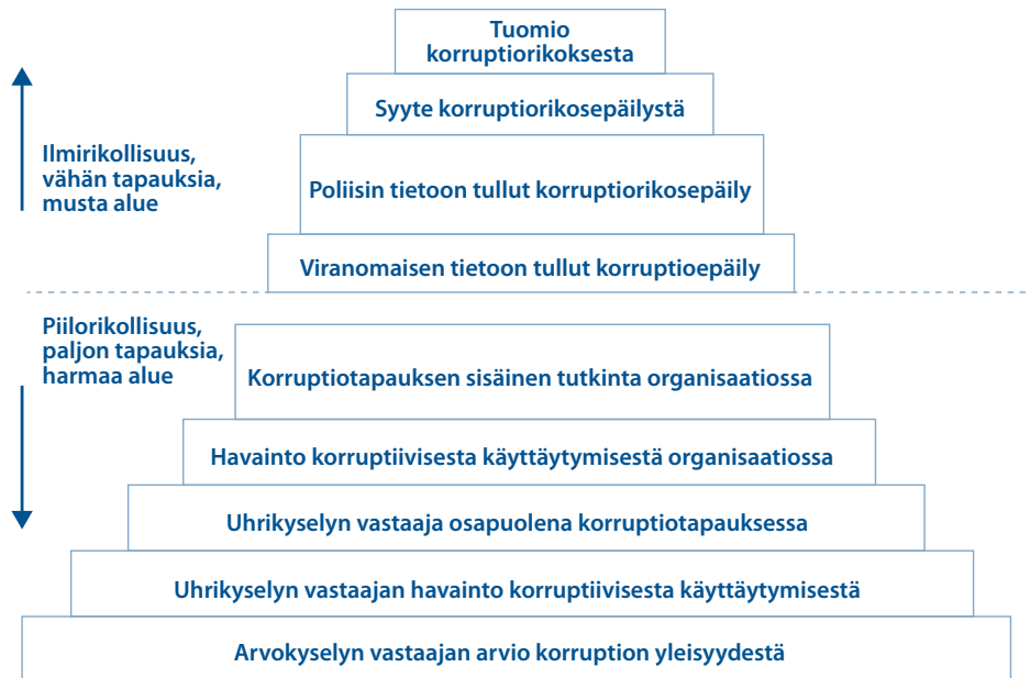
Kuvio 1. Korruption tasot ja tietolähteet*

Suomessa lahjusrikoksia koskeva lainsäädäntö on viime vuosina merkittävästi laajentunut. Suomen rikoslaissa on 14 lahjontaa koskevaa pykälää. Korruptiota on kuitenkin vaikea tutkia empiirisesti, koska sen osapuolilla on motiivi pitää se piilossa. Kuvio yksi kuvaa sitä, että korruptiorikoksissa annetut tuomiot ovat vain jäävuorenhuippu ja suurin osa korruptiosta jää todennäköisesti julkisuudelta piiloon.