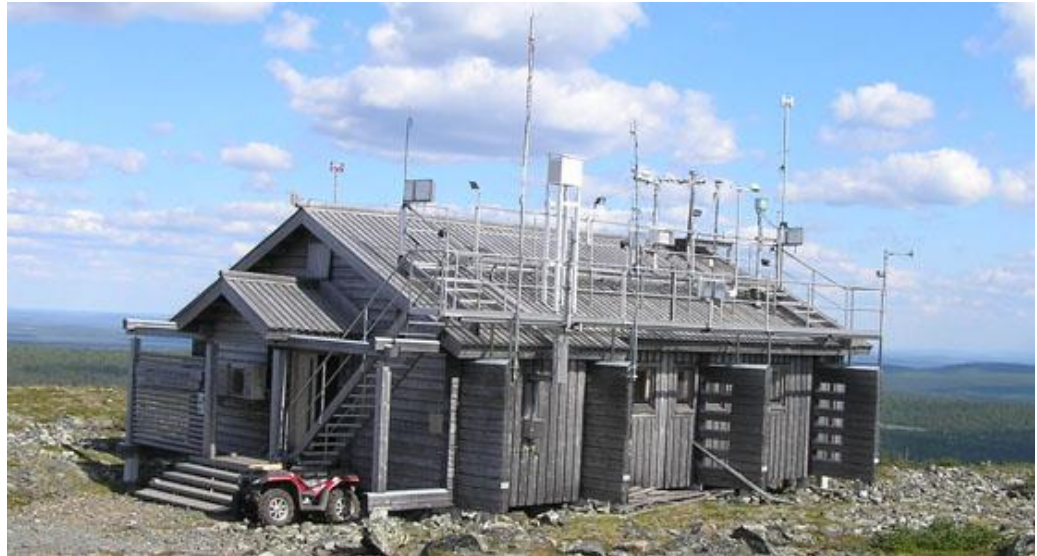
INAR RI, Mittausasema Pallaksella.