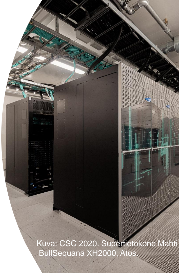
Supertietokone Mahti BullSequana XH2000, Atos.