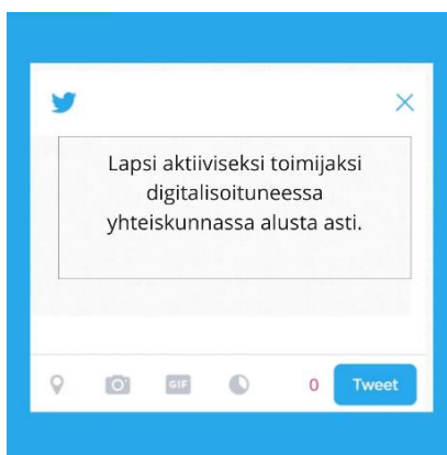
Kuva 1: Kiteytystwiitti lasten digitaitojen takaamisesta

Digitaaliseen yhteiskuntaan liittyviä taitoja ja osaamista tulee tarkastella riittävän laajasti - ne ovat ongelmanratkaisutaitoja ja kyvykkyyttä löytää tietoja. Olennaista on myös motivaatio ja lasten oikeus myös itse määrittellä taitoja, joita he haluavat oppia. Digitaalisten kehittämisessä lapsista ja nuorista puhutaan usein diginatiiveina. Diginatiivi-termillä tarkoitetaan digitaalisena aikakautena syntyneitä lapsia. Diginatiivi ei siis suoraan ota kantaa lasten tai nuorten digiosaamiseen. Pienikin lapsi tai koululainen voi jäädä ulkopuolelle ilman taitoja, laitteita ja yhteyksiä.