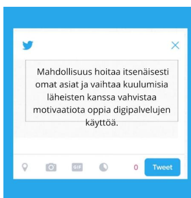
Kuva 4: Kiteytystwiitti ikääntyneiden motivoinnista digitaitojen kehittämiseen ja ylläpitoon

Nykyhetken tilanteessa ikäihmiset selviävät vielä heikoillakin digitaidoilla. Osa ikäihmisistä ei koe, että digitaalisista palveluista olisi itselle hyötyä, jolloin motivaation vahvistaminen olisi tärkeää. Osa taas tulee toimeen analogisten ja digipalvelujen välimaastossa kehittämällä tarvittavia digitaitoja, koska he haluavat hoitaa itse omat asiansa ja ovat kiinnostuneita digitaitojen kehittämisestä. Osa käyttää sujuvasti teknologian tuomia mahdollisuuksia.